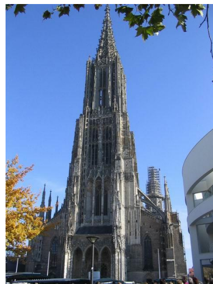
Fot. Katedra w Ulm – XIV w