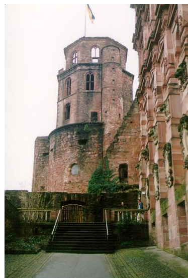
Fot. Zamek Heidelberg

Wszystko trwało zbyt krótko, czas się żegnać już ... Niech nam będzie smutno – Cześć! – Auf Wiedersehen!