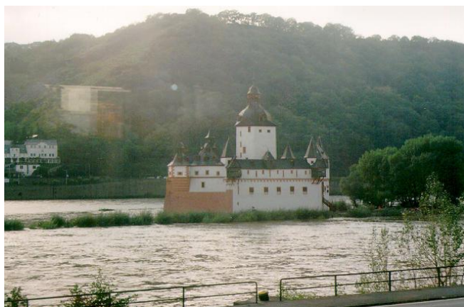
Fot. Zameczek pośrodku Renu

Klimat umiarkowany, łagodny, pozostający pod wpływem Oceanu Atlantyckiego, zimy łagodne z częstymi odwilżami, lata ciepłe.