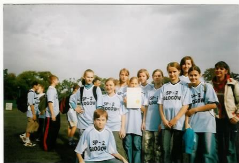
Fot. Drużyna biegów przełajowych