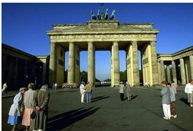
Fot. Berlin - Brama Brandenburska

Hamburg, Monachium, Kolonia, Frankfurt nad Menem, Lipsk, Brema, Stuttgart, Essen, Drezno, Hanower,