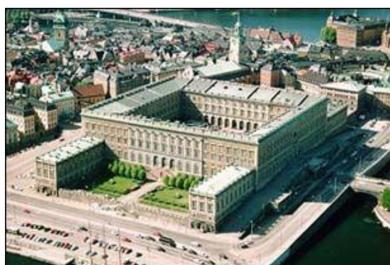
Fot. Zamek królewski w Sztokholmie

Głową państwa jest król (obecnie panuje Karol XVI Gustaw ).