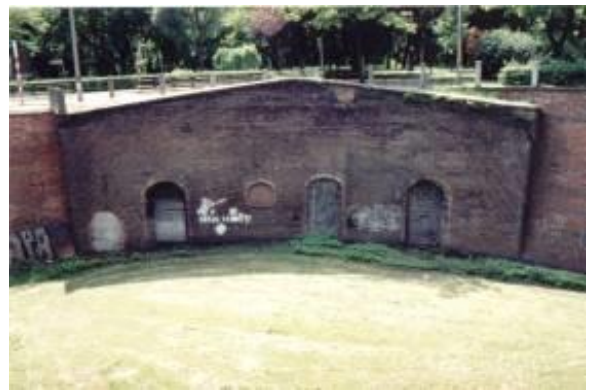
Fot. Fosa miejska - wejście do tunelu i kazamaty

Innym interesującym obiektem, mającym połączenie z fosą jest wielka kazamata .