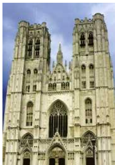
Fot. Katedra Notre Dame

Głową państwa jest król (obecnie panuje król Albert II ). Władza ustawodawcza należy do dwuizbowego parlamentu federalnego.