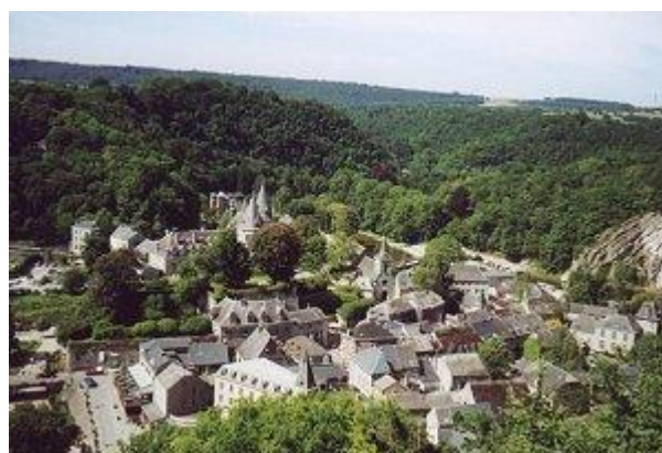
Fot. Widok na Ardeny

Między stolicą a rozległą doliną rzek Sambrę i Mozy znajduje się lekko falista równinna, a dalej na południe-górzysty obszar Ardenów .