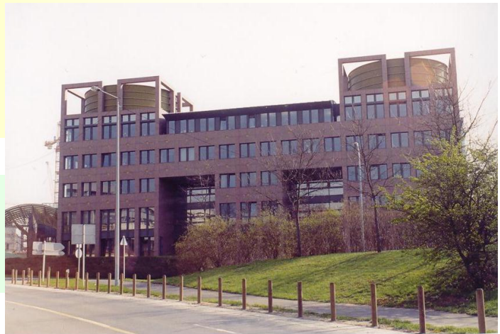
Fot. Budynek Europejskiego Trybunału Sprawiedliwości i Sądu Pierwszej Instancji.