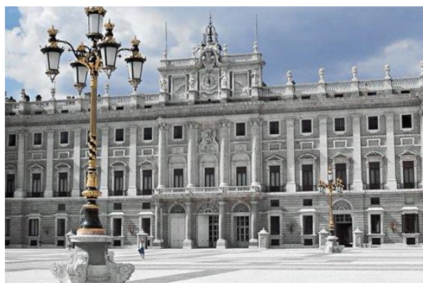
Fot. Pałac Królewski w Madrycie